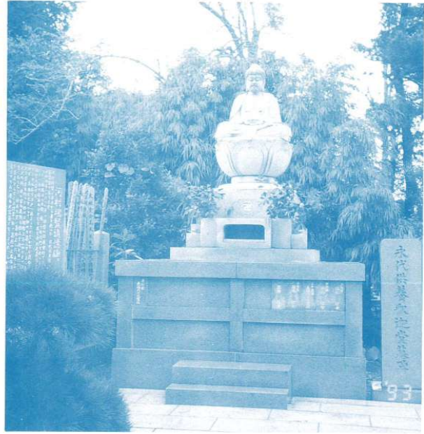
東陽寺 永代供養釈迦堂

永代供養釈迦堂は宗教法人東陽寺が運営管理しています。承継者のない方でも求められ、永代に供養が受けられます。